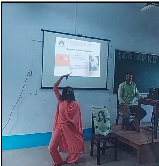
Departmental Cultural Programme in celebrating Raksha Bandhan conducted by Rabindranath Tagore