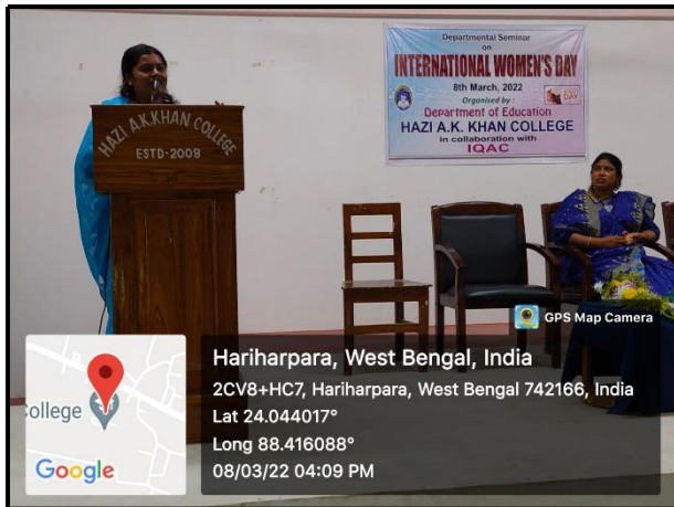
Departmental seminar conducted on 08.03.22 in celebrating International Women's Day