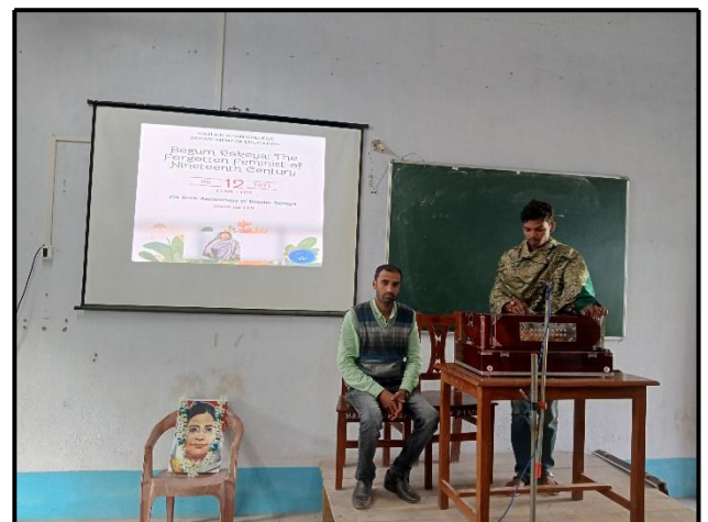
Departmental Cultural Programme in celebrating Birth anniversary of Begum Rokeya