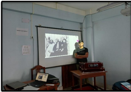
Cultural Programme in the Department