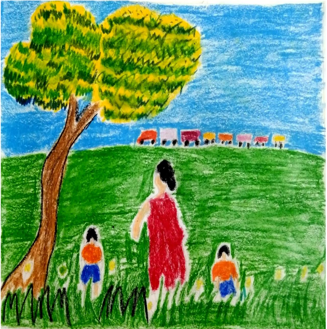
Selim Mandal, Student, Education Honours