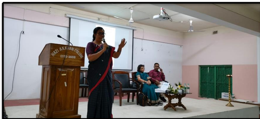
State Level Seminar in celebrating International Women's Day organized by the Department