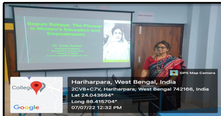
State Level Seminar organised by the Department