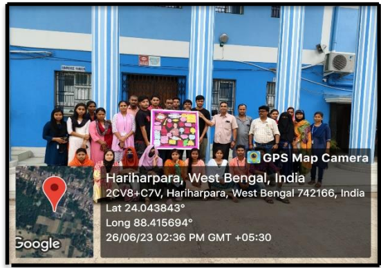
Departmental Wall Magazine