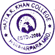
Principal Hazi A.K. Khan College Hariharpara, Murshidabad

৭) সামগ্রিক অনুষ্ঠানটির ব্যাপারে কিছু জানার প্রয়োজন হলে উপরিউক্ত চারজন শিক্ষক-শিক্ষিকাদের সঙ্গে যোগাযোগ করতে হবে।